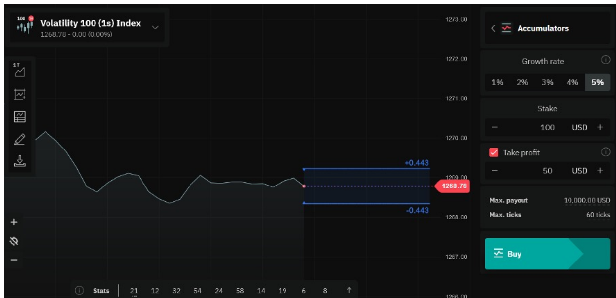
tasa de crecimiento de 5%