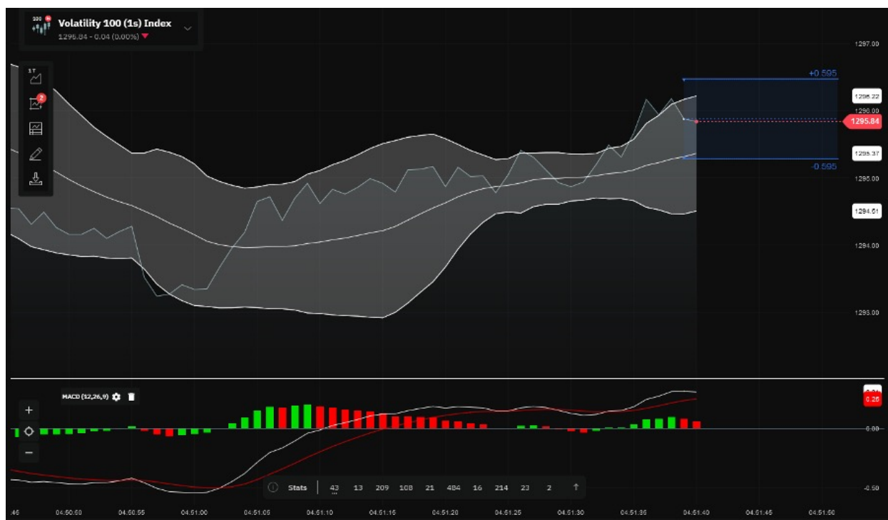
Un gráfico complementado con bandas de Bollinger y MACD

Dado que se trata de opciones a corto plazo, el gráfico por defecto es un gráfico de ticks, también conocido como gráfico de líneas. Puede mejorar este gráfico con herramientas populares de análisis técnico, como medias móviles, bandas de Bollinger y MACD.