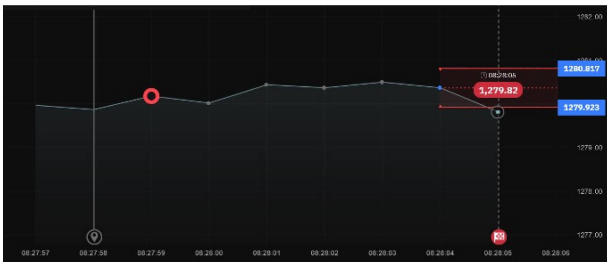
Se supera la barrera inferior, por lo que la opción se cierra a cero.

Si no cierra una opción de accumulator antes que se supere el nivel de barrera superior o inferior, se cerrará automáticamente. Cualquier ganancia acumulada no obtenida se perderá junto con su inversión. No tendrá ninguna exposición hasta que coloque una nueva operación. El ejemplo siguiente muestra una operación de accumulator perdedora en la que el precio spot del mercado cayó por debajo del precio de barrera inferior.