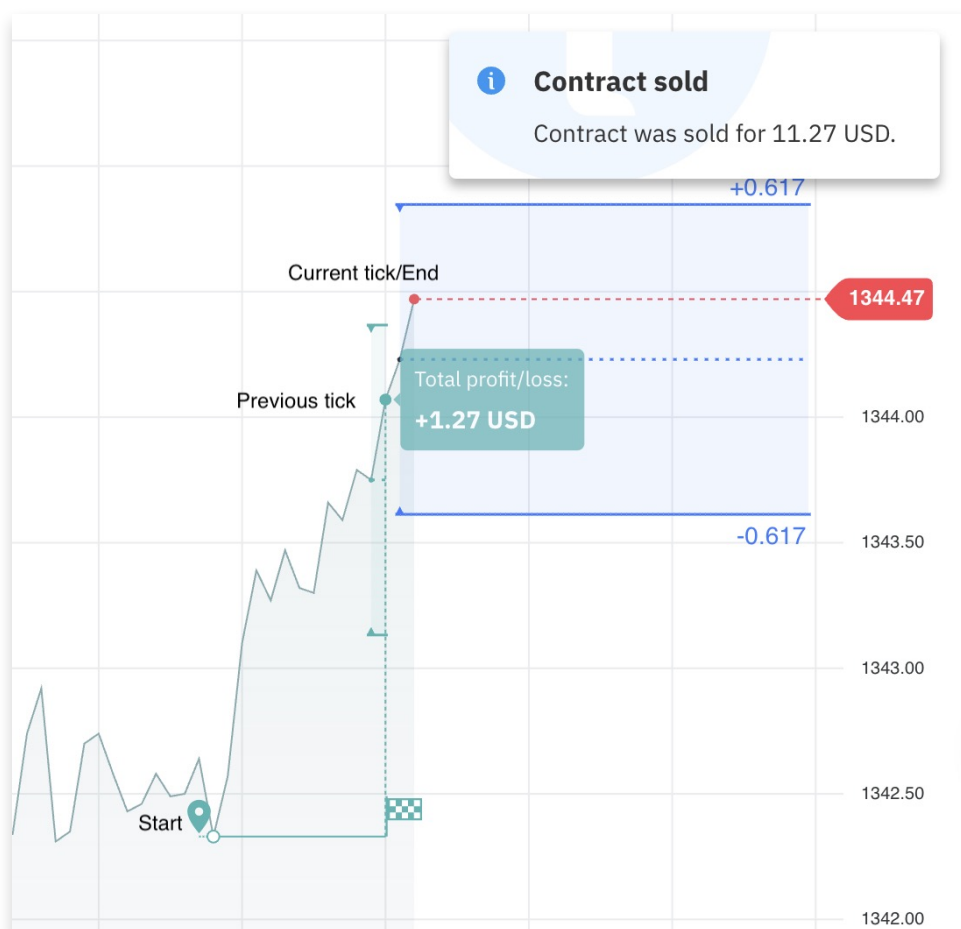
Una operación con opciones accumulators en Deriv Trader exitosa

Con las opciones de accumulator, su pago crecerá exponencialmente siempre que el precio spot actual se mantenga dentro de un rango establecido con respecto al precio spot anterior. Tendrá que cerrar la operación antes que alcance la barrera superior o inferior de este rango para asegurarse el pago.